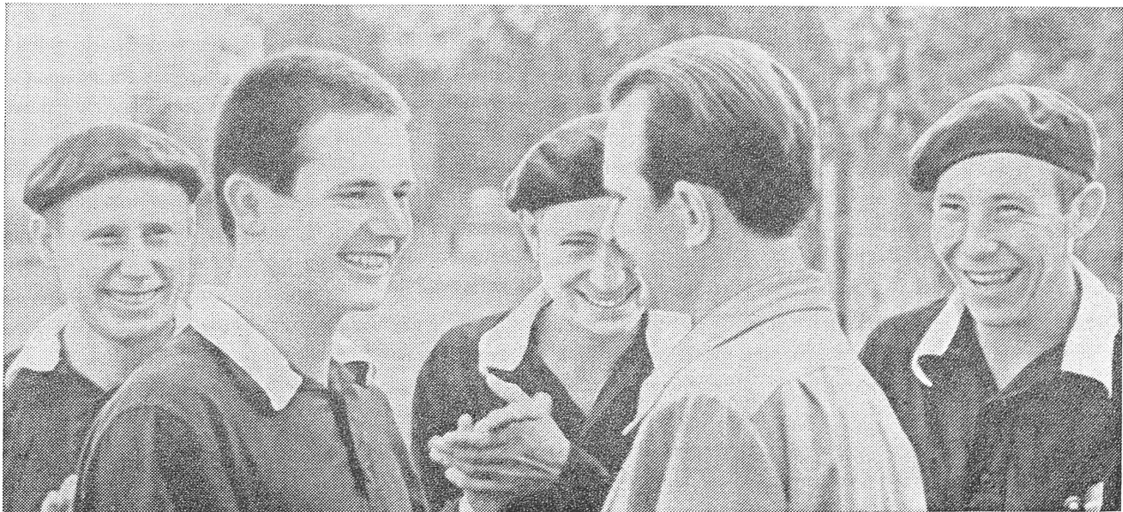
Freundliche Betreuung in Jugendstrafanstalt bei Ufa.

Damit die Familie der von der Partei gezeichneten Entwicklung folgt, wollen Partei und Staat den Familienmitgliedern auch die notwendige ideologisch-politische Ueberzeugung beibringen («Kommunist Sowjetskoj Latwii», Nr. 9/1971, S. 73—77); in dieser Arbeit bekommt die Schule die Hauptrolle. Die Schulleitung wird aufgefordert, für die Eltern Vorträge über Erziehung und spezielle sogenannte «Familientage» zu veranstalten. Angesichts dessen, dass an der Kindererziehung Eltern und Grossmütter bzw. Grosseltern beteiligt sind, sollen die Vorträge möglichst getrennt für Väter, Mütter, Grossväter und Grossmütter abgehalten werden. («Kommunist Estonii», Nr. 1/1967, S. 17—20.)