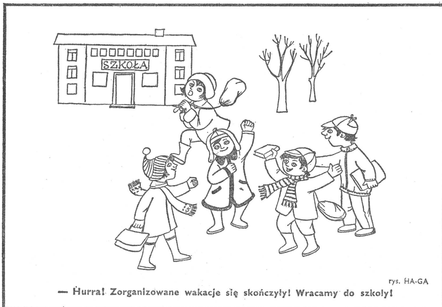
— Hurra! Zorganizowane wakacje się skończyły! Wracamy do szkoły!

Ausser den Betrieben sorgen auch die lokalen Behörden und deren Aemter für die Kindererziehung. In den Mikrorayons richtet man ebenfalls entsprechende Kinderzimmer und Kinderklubs ein. Im Kirow-Bezirk der Stadt Jaroslawl zählte man 27 Pionier-Kinderzimmer, für jeden «Kreis» eines. Die Hausverwaltungen und die Betriebe haben die Zimmer mit Möbeln, Fernsehapparaten, Radios, Sportgeräten und Büchern ausgestattet. An der Arbeit mit den Kindern nehmen die Eltern, die gesellschaftlichen Aktivisten und die Pädagogen teil. In einem