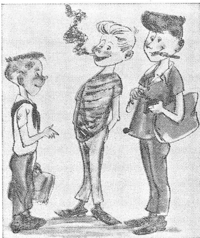
«Wir haben unsere Produktionspraxis eben schon hinter uns.» («Krokodil», Moskau)

Mitte der 60er Jahre führte man in Auserbaidschan die «Väterversammlungen» ein, auf denen