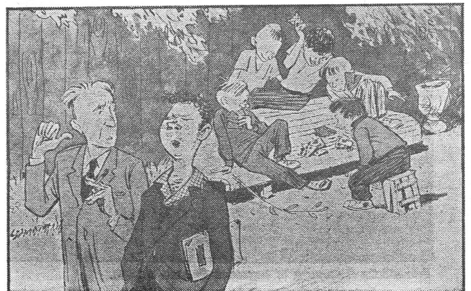
«Da spielen die Lümme! Karten (in der UdSSR verboten), und jeder-mann geht achtlos vorbei.» «Ja, was wollen Sie. Ich habe mich zum Beispiel gestern mit den Buben abgegeben, aber dabei drei Rubel verloren.» («Krokodil», Moskau)

Auch die ungarischen Elternkomitees (Elterliche Arbeitsgemeinschaft genannt) müssen sich «für die Aufhebung der Doppelspurigkeit zwischen der Erziehung in der Schule und in der Familie» einsetzen. Ansonsten haben sie die gleichen Aufgaben wie die polnischen Elternkomitees.