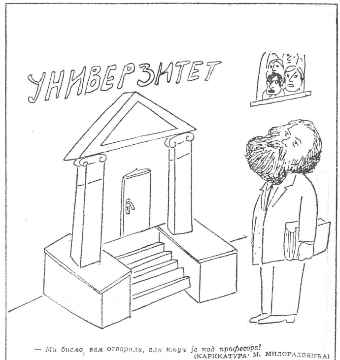
— Ми бисмо, вам отворили, али кључ је код професора! (КАРИКАТУРА: М. МИЛОРАДОВИЋА)