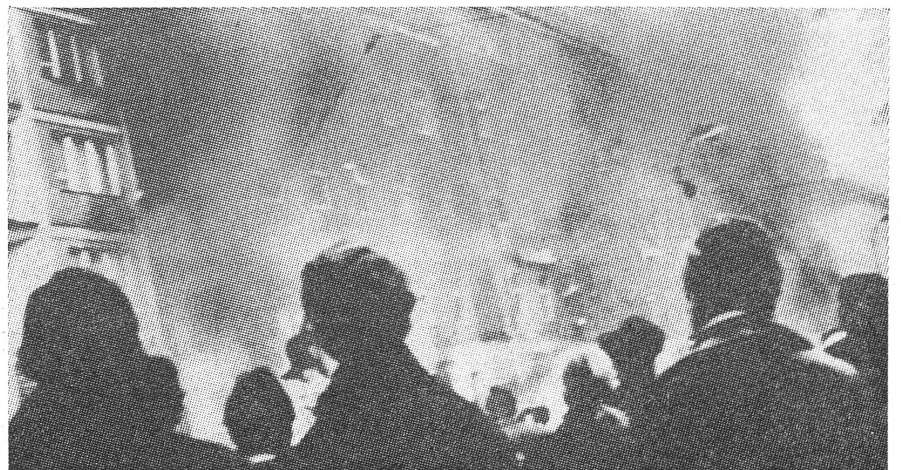
Die neue Parteiführung unter Gierek fand nicht nur im kulturellen und übertragenen Sinn verbrannte Erde vor, sondern auch nach den Arbeiterunruhen vom Dezember 1970 im wörtlichen Sinn verbrannte Häuser. Hier hatten Demonstranten die Polizeizentrale von Szczecin in Brand gesteckt.