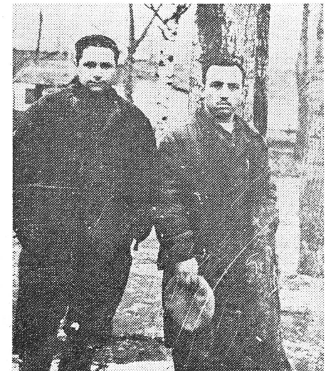
Die Kontinuität der KZ in der UdSSR wurde nie unterbrochen, auch nicht während der Zeit Chruschtschows: Dieses Bild aus einem mordwinischen Lager für politische Häftlinge stammt aus dem Jahre 1960.

Unter den Häftlingen sind verschiedene Nationalitäten, darunter viele Juden. Die Administration fördert den Antisemitismus. ■