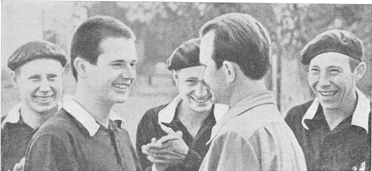
Bilder («Sowjetunion heute», Moskau) aus der Jugendstrafanstalt von Ufa: Besprechung...

Autors), wonach 49 Prozent der Verbrechen, die Minderjährige im Ural begehen, ohne deutliche Motive erfolgten. «In den letzten Jahren ist der Anteil der Schwerverbrechen — Räuberei, Vergewaltigung — bei der Jugendkriminalität gestiegen. Bemerkenswert ist die Zufälligkeit des Anlasses zur Begehung von Verbrechen durch Personen unter achtzehn Jahren, ihr nicht vorsätzlicher Charakter.»