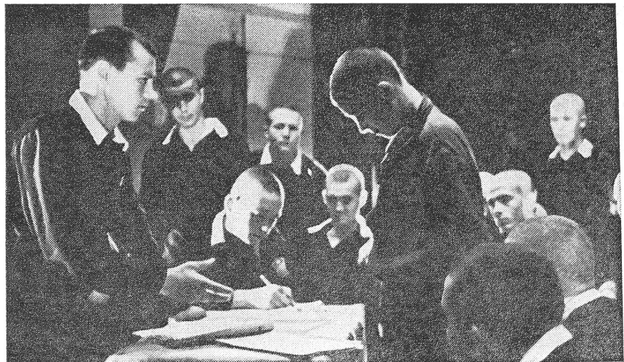
... und Kameradschaftsgericht.

Ja, genau! ruft ein besserungswilliger Rowdy aus dem Straflager (Leserbrief an die LG Nr. 5/1974), S. 11): Die Erwachsenen sollen sich doch der ziellosen Jugendlichen annehmen. «Wir brauchen ein Ziel!»