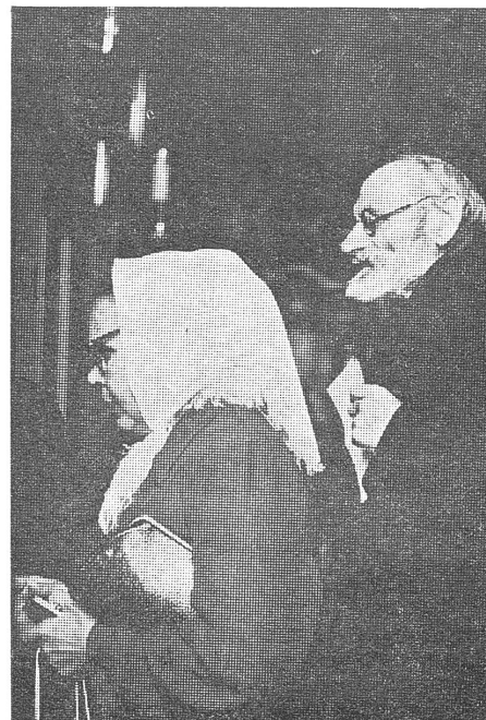
... und der inoffizielle Glauben. («Sowjetischer Alltag im Bild», Buchtip ZB, 30/1970)

Beim Lesen Ihrer Zeitschrift muss sich beim Publikum die Meinung bilden, dass es in der