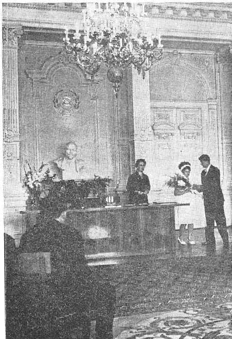
Die offizielle Devotion ... (Eheschliessung unter dem Segen Lenins)

der schaffen, einander besser kennen und auf- richtiger, ohne Bedenken ihre Meinungen aus- tauschen sollten.