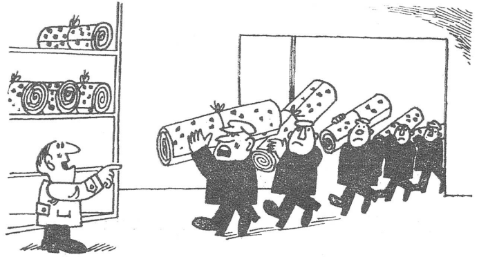
«Die neue Lieferung?» – «Ne, Reklamationen!» (Nr. 29/1973)