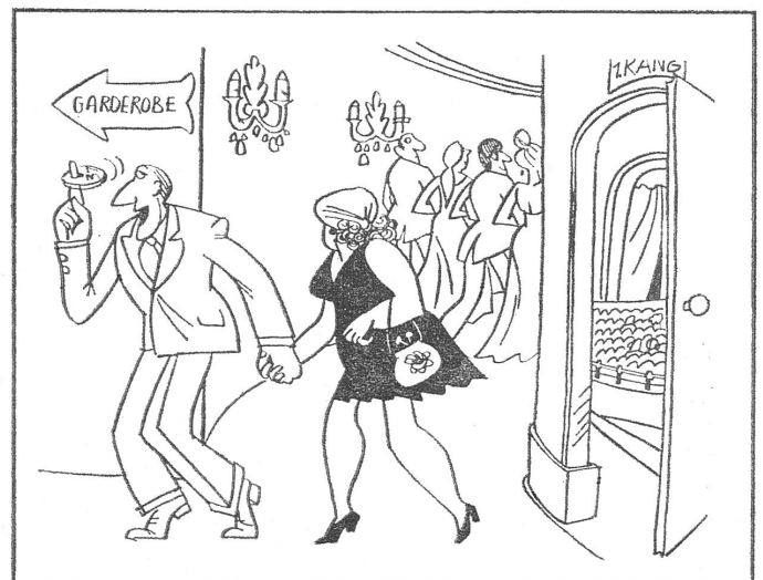
«Die von der Brigade haben uns gesehen – jetzt können wir abhauen.» (Wenn man die «werktätigen Massen» ins Theater bringt, sind sie nicht immer so dankbar wie sie sein sollten – oder liegt es am Vorschriftstheater?) Nr. 2/1974