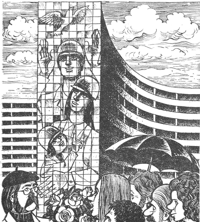
Kunst am Bau: «Dank für das schöne Kachelbild, Herr Professor. Nun regnets am Giebel nicht mehr durch.» (Nr. 3/1974)