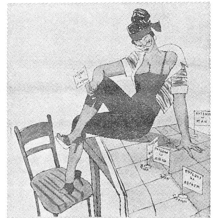
«Ihre Kuraufenthaltskarte.» Diese «Krokodil»-Karikatur nimmt jene besseren Leute aufs Korn, welche sich die gewerkschaftlichen Urlaubsscheine, auf welche werktätige Belegschaftsmitglieder oft lange warten müssen, zu ausgiebigen Ferien selber reservieren.

Ich ging den Reissbrettern entlang — kein einziges kam mir bekannt vor. Ich habe von Kind an ein schlechtes visuelles Gedächtnis gehabt. Wenn ich etwas länger als einen Monat nicht gesehen habe, kann ich mich nachher schon nicht mehr daran erinnern. Und da konnte man noch eine Zeichnung nicht von der andern un-