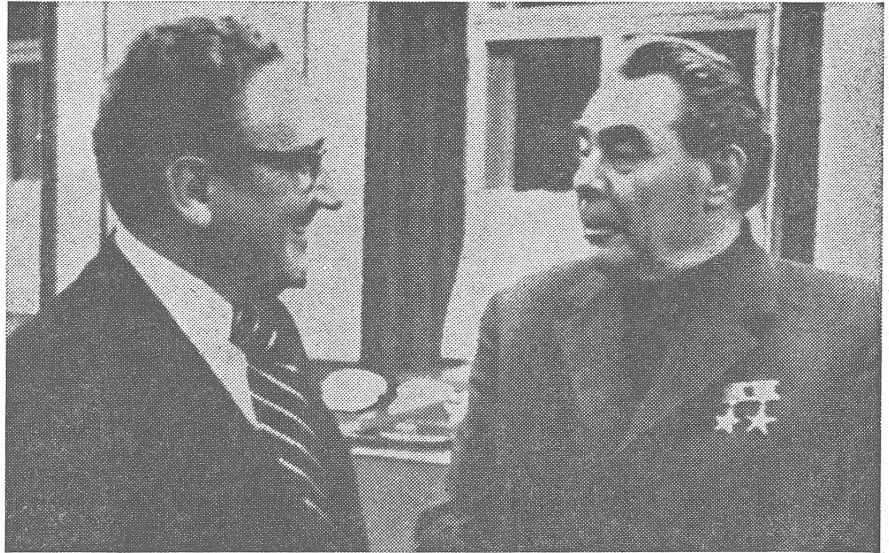
Kissinger mit Breschnew bei ihren Unterredungen in Moskau. Liegt für Israel eine Hoffnung in gemeinsamen Garantien dieser Art?

Trotzdem herrscht in Israel keine Siegestimmung. Die Israeli bezahlen wieder einmal ihre traditionelle hohe Blutsteuer, um am Leben zu