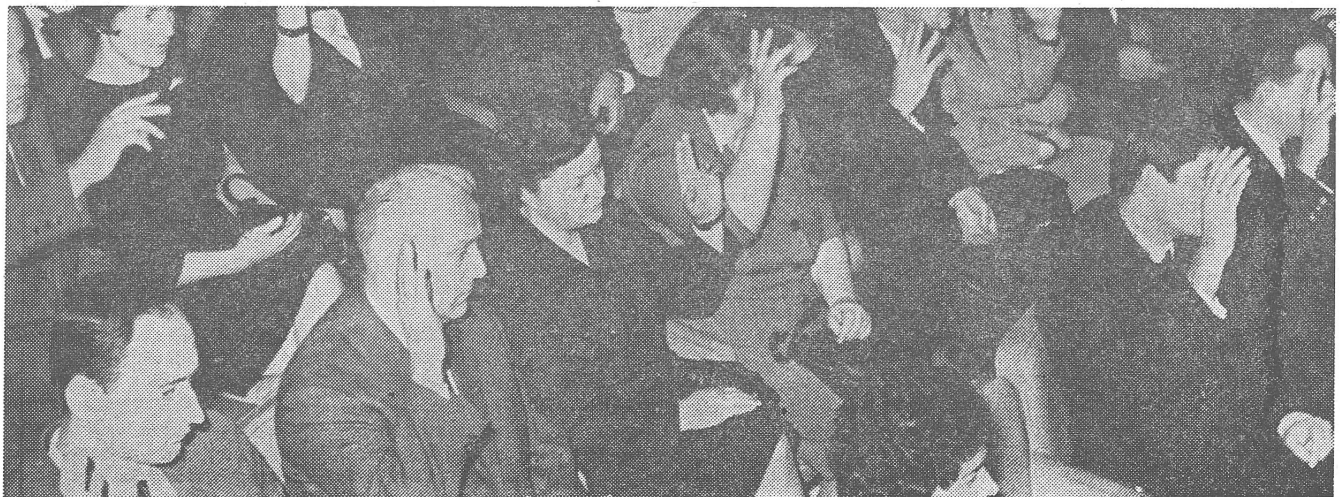
Delegiertenwahl in Konferenz der Arbeiterselbstverwaltung.

Das Fazit ist wohl dies, dass die SV auf die Ebenen beschränkt bleiben muss, auf denen sie überhaupt erfolgreich aufgebaut werden kann: auf die Ebenen der Staatsordnung. Dagegen sind Wirtschaft, Kultur, Wissenschaft, ja auch Sport, Erziehung und Landesverteidigung Ebenen, die sich nur sehr bedingt durch SV ordnen lassen. Eine bessere und breitere Chancengleichheit, eine bessere und breitere Information der Träger von Institutionen dieser Art sind erfolgsversprechender, wenn auch anspruchsvollere Rezepte als die Selbstverwaltung. ■