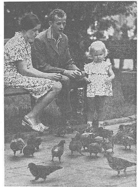
Junge Leute in Polen: Die kleine Sehnsucht nach dem kleinen Glück...

In Polen verfügen 90 Prozent der Jugendlichen zwischen 16 und 24 (!) Jahren nicht über ein eigenes Zimmer. Die Mehrheit der jungen Leute betrachtet die Arbeit vorwiegend, wenn nicht ausschliesslich als Verdienstquelle. Unter Erfolg und Gelingen versteht offenbar niemand den Dienst an gesellschaftlichen Zielen. Das sind einige Ergebnisse aus einer Umfrage, über welche die deutschsprachige Ausgabe von «Zycie Warszawy» berichtet hat. Wir bringen den Bericht in seinem Wortlaut. Nebenbei ist er ein weiterer Beleg dafür, dass die polnische Presse trotz der totalen Anpassung an die sowjetischen Wünsche zur Aussenpolitik immer noch ihren Spielraum bei der Wiedergabe und Beurteilung innenpolitischer Zustände hat. In diesem Falle sind die unspektakulären Resultate der Umfrage gerade in Hinsicht auf westliches Selbstverständnis der Jugend interessant. Die befragten Jugendlichen in Polen vermitteln in ihrer Gesamtheit das Bild, das man sich bei uns von ihrem «kleinbürgerlichen Sektor» macht, welches sich vom «herrschenden System» im Kapitalismus manipulieren lasse. Und das alles auf einem niedrigeren materiellen Niveau. Dazu kommt man also bestenfalls, wenn man die hier angepreisene Systemveränderung durchgeführt hat. Von den dort vorenthaltenen Chancen, einem alternativen System auch nur das Wort zu reden, ist dabei erst noch abzusehen. Und damit zur kleinkarierten Welt, die sich immer noch vom gleichgerasterten Bild in der sozialistischen Umgebung positiv abhebt: