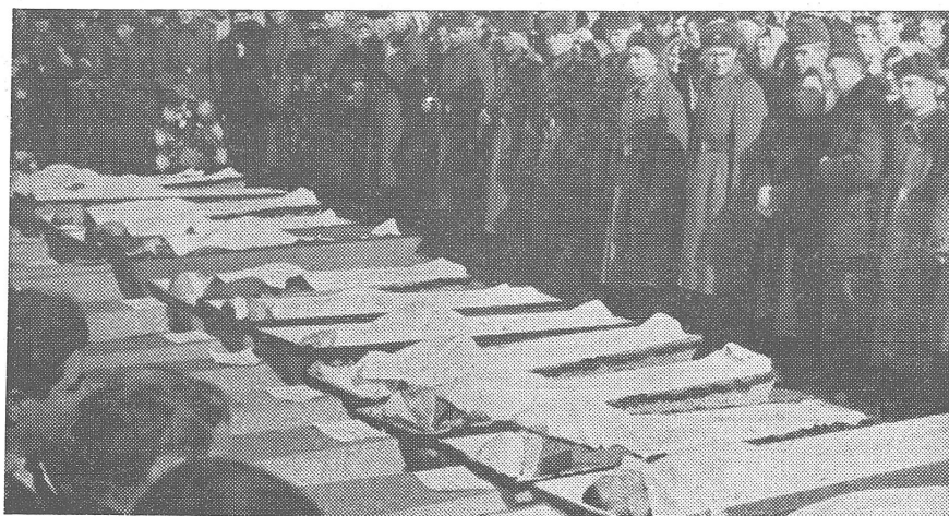
Vor drei Jahren war es an der chinesisch-sowjetischen Grenze zu Scharmützeln gekommen. «Sowjetunion heute» hatte dieses Bild mit der Legende veröffentlicht: «Soldaten des Grenzschutzes von der Grenzwahe Nischne-Nicholowka, die ihr Leben bei der Verteidigung der sowjetischen Staatsgrenze gegen die chinesischen Provokateure hingegeben haben.» Wird aus den Zusammenstössen von gestern der sowjetische Einmarsch von morgen?

auch in anderen Gegenden des Landes eingeführt, namentlich im hohen Norden, im Taimyr, in den Mündungen der grossen sibirischen Flüsse — Lena, Ob, Jenissej, sogar in sonst allgemein zugänglichen Orten wie dem östlichen Teil des Gebiets Archangelsk, dem Bezirk Nar'jan-Mara und in einigen anderen höchst unerwarteten Gebieten. Das erklärt sich aus der Erweiterung des Netzes der Straflagern in diesen Gebieten und der Ueberführung eines Teils der Häftlinge aus den «traditionellen Lagergebieten» dorthin — aus dem Gebiet Irkutsk, Kasachstan (besonders dem Süden), Zabajka-l'e, einigen Gebieten des Fernen Ostens. Es stimmt, es wird eine Umteilung vorgenommen. Die hauptsächlichlichen Menschenkontingente (wie sich die Lagerleitung gern «wissenschaftlich» ausdrückt) werden stufenweise nach dem Norden übergeführt.