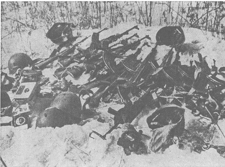
Die Zwischenfälle am Ussuri von 1969 in chinesischen Reportagen. Oben: Einheiten der sowjetischen Stromflottille gehen mit Wasserwerfern gegen chinesische Fischerboote vor. Unten: Von den Chinesen erbeutete sowjetische Waffen und Geräte.

schlüsse fassen kann in jeder beliebigen Konfliktsituation. Hier ist die bekannte Analogie mit dem Verteidigungskomitee angebracht, das Stalin nach dem Beginn des Krieges mit Deutschland 1941 schuf. Dieses Komitee spielte seine Rolle im Kampf mit den Deutschen, und nun will man diese Erfahrung nochmals anwenden. Nur beschloss man jetzt, den Kriegsführungstab nicht nach seinem Beginn, sondern vorher zu gründen.