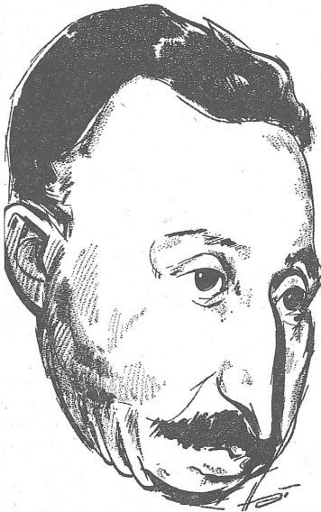
Der Generalsekretär der prosovjetschen chilenischen KP, Luis Corvalan, sagte im Herbst 1972: «Als die Rechte einsah, dass sie nicht auf die Armee zählen konnte, wählte sie den Weg des Generalstreiks, um die Aktivitäten Chiles zu lähmen und das Land zu ersticken.»

Aber wie hatte man das vor Tisch gelesen? Durch ihre vorherige Präsenz hatten die USA durch ihre Gesellschaften doch das Land ausgebeutet, sich auf Kosten Chiles bereichert, nicht? Nun hatte Chile die Kupferbergwerke usw. entschädigungslos enteignet (d. h. eigentlich sogar mehr als das: man stellte noch eine Nachrechnung für übermässige Profite zuvor) und sie danach, befreit von der ausländischen Ausbeutung, zum Wohle des eigenen Landes arbeiten