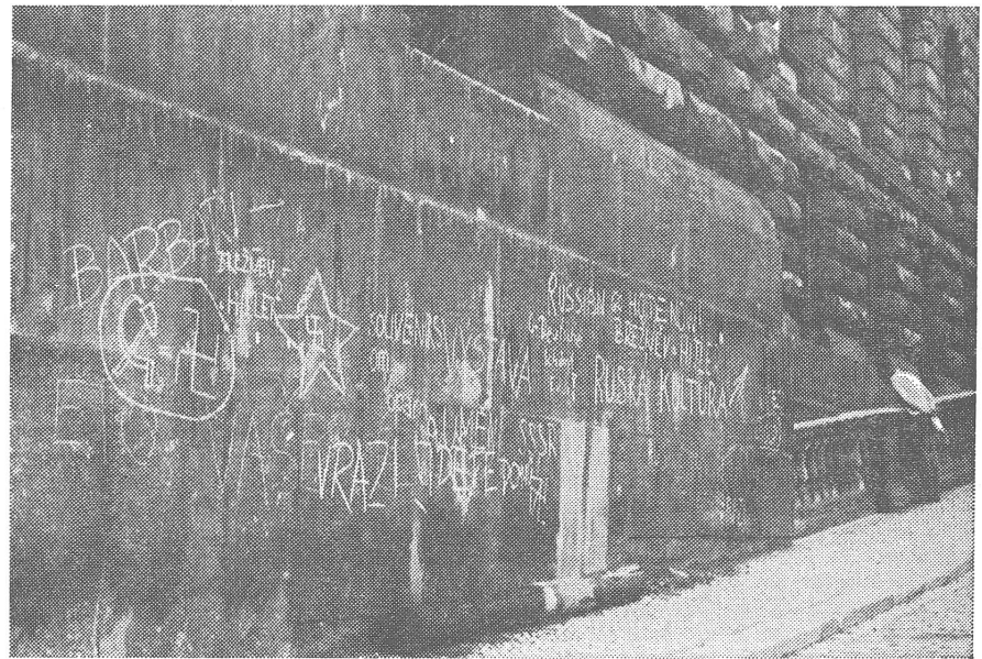
Stimme des Volkes – Stimme Gottes? In den Mauerinschriften kam der rasche Zorn des Volkes zum Ausdruck. Zwischen Hakenkreuz sowie Sichel und Hammer, zwischen Hitler und Breschnew sieht das tschechoslowakische Volk nebensächliche Unterschiede.

Die moralischen, patriotischen und politischen Verpflichtungen, die Dr. Jiri Hajek in den ersten Stunden des Einmarsches der Warschauer-Pakt-Truppen in die Tschechoslowakei restlos erfüll-