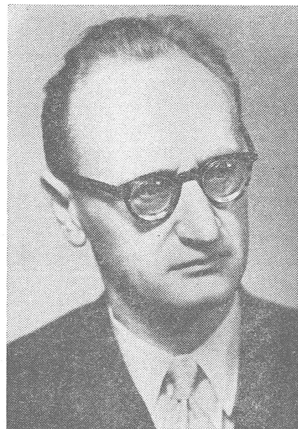
Jiri Hajek, der Aussenminister mit der neuen Linie, wurde Opfer von Husaks Säuberungen.

Der Kapitulationston, der aus dieser Chiffre klar und eindeutig herauszuhören war — und der dann in allen Depeschen des tschechoslowakischen Aussenministeriums an die diplomatischen Vertretungen der Tschechoslowakei erklang, gab uns in der Redaktion der «Obrana lidu» in Prag