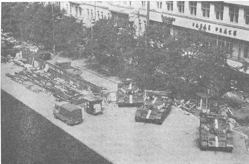
Das Gesicht der militärischen Invasion, die heute zur friedlichen Hilfeleistung gegenüber einem befreundeten Volk umfunktioniert wird.