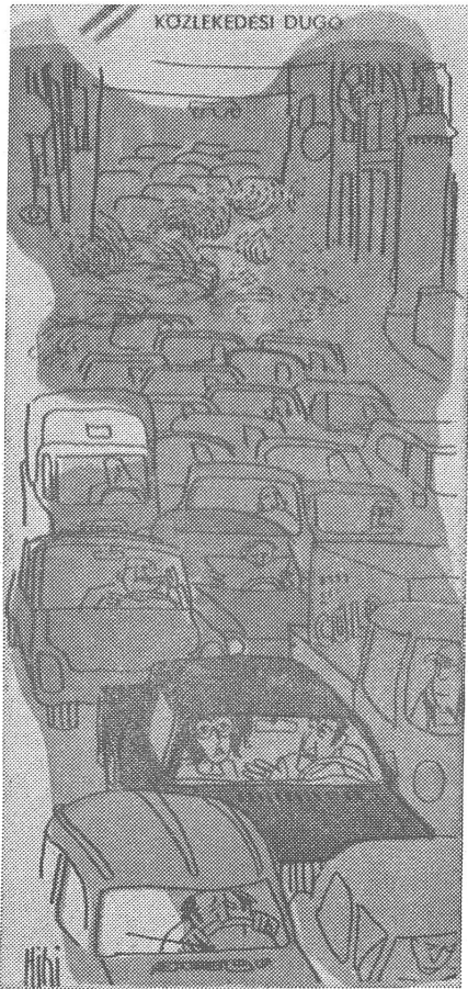
«Sei nicht ungeduldig. Wenn wir auf unser Auto zwei Jahre warten konnten, so spielen diese paar Stunden überhaupt keine Rolle.»