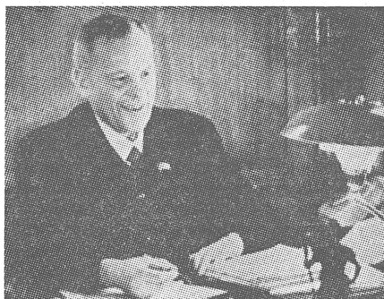
Zwischen Recht und Willkür: Lew Smirnow, Vorsitzender des Obersten Gerichts der UdSSR.

Im Sinne der Justizreform von 1958 können die gesellschaftlichen Organisationen und die Arbeitnehmerkollektive an den Gerichtsverhandlungen durch «gesellschaftliche Ankläger und/oder Verteidiger» teilnehmen und durch diese die Uebergabe der Verurteilten an das Kollektiv zwecks Umerziehung verlangen. Wie in der Lite-