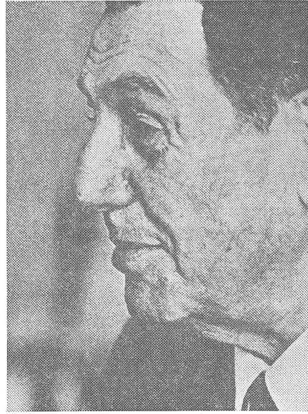
Jetzt in Argentinien zusammengekommen: Präsident Campora und sein Mentor Peron.