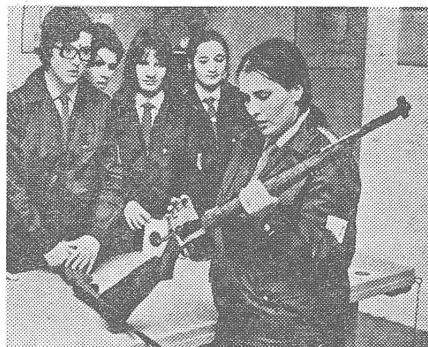
Neben der Rüstung gibt es in der UdSSR so gut wie in ganz Osteuropa, noch die Militarisierung (siehe dazu unsere Sondernummer in ZB Nr. 19/1972). Hier die «patriotische Ausbildung» in einem Budapester Mädchengymnasium. Sie ist obligatorisches Schulfach.