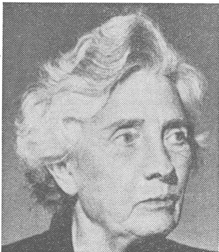
Von den Schergen Hitlers gesucht, von den Schergen Stalins gefunden: Anna Kethly.

Anna Kethly, Jahrgang 1889, engagierte sich zunächst in der ungarischen Gewerkschaftsbewegung und war ab 1919 die prägende Gestalt der sozialistischen Frauenbewegung. Von 1922 bis 1948 gehörte sie (zur Zeit der hitlerischen Besetzung im Untergrund) dem sozialdemokratischen Parteivorstand und dem Parlament an, zu dessen Vizepräsidentin sie nach 1945 wurde. Sie gehörte zu den repräsentativsten Gegnern des Horthy-Regimes, und ihre Feindschaft zum Faschismus in allen seinen Formen liess sie auch gegen die Vereinigungspläne von KP und SP Stellung nehmen. Auf Geheiss von Rakosi wurde sie deshalb zusammen mit andern demokratischen Persönlichkeiten als «Rechtselement» aus der Partei ausgeschlossen, was zu den Vorbereitungen der Fusion gehörte. Von 1949 bis 1956 sass sie im Gefängnis. Kurz darnach arbeitete sie erstmals mit Kommunisten zusammen, nämlich während der ungarischen Revolution als Staatsminister in der Regierung von Imre Nagy. Am 1. November 1956 befand sie sich zu einer Besprechung in Wien, als die sowjetische Invasion ihre Rückkehr verunmöglichte.