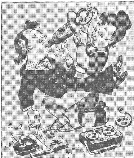
«Der Säugling und seine liebe Mutti. Uebrigens sind auch die Onkel, Tanten, Landsleute (aus derselben Region), Nachbarn und sogar die Chefs ebenso lieb.»

Die fürchterliche Strafe: «Für dein systematisches Blaumachen und Trinken haben wir beschlossen, dir die Eintrittskarte zum Symphoniekonzert zu entziehen.»