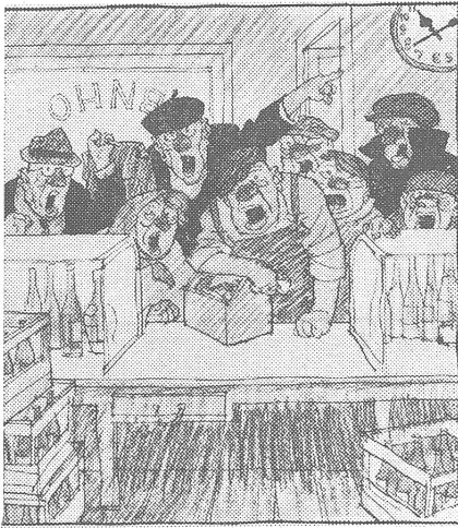
Im Spirituosenladen: «Wieder niemand da! Wie lange sollen wir eigentlich noch Arbeitszeit verplumpen?»