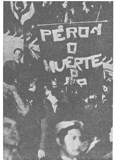
Das war die Stimmung des Wahlkampfes gewesen. «Peron oder Tod» hatten die Plakate verkündet.

len Anti-Yankeeismus als einzige einheitliche Tendenz aufweisen. Auf das, was Peron während der langen Jahre seines Exils gesagt hat, kann man nicht bauen, wenn man eine Prognose über Argentiniens künftige Wirtschafts- oder Aussenpolitik machen will. Es bleibt dem Zufall und den argentinischen Opportunisten überlassen, wie Argentiniens Geschehnisse in der Zukunft geleitet werden.