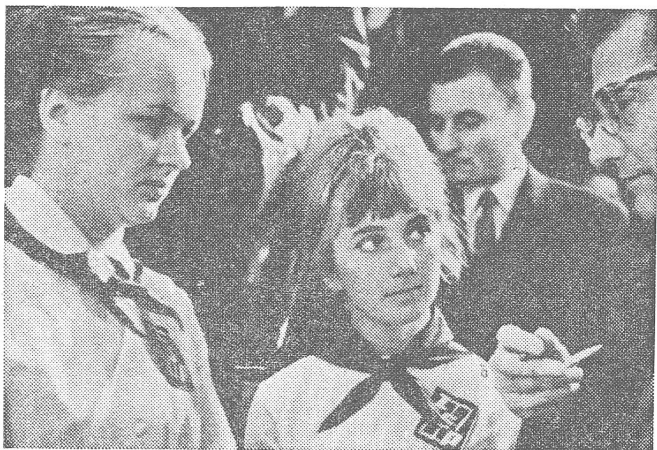
Studentinnen der Slask-Universität (Katowice) in der Uniform von Pionierleiterinnen. (Aus «Polen-Kaleidoskop», Warschau 1972)