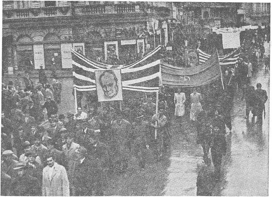
Kommunistische Demonstrationen unmittelbar nach der Befreiung (hier in Bukarest) umschlossen noch Solidaritätsbezeugungen gegenüber allen Alliierten.

Man könnte zum Beispiel mit Sicherheit Hunderte oder Tausende von Einzelschicksalen auswählen, die beweisen würden, dass die Menschen drüben auf Grund jener Aenderungen besser und glücklicher leben. Ich nenne ein Beispiel: Ungarn war vor dem 2. Weltkrieg das Land der drei Millionen Bettler genannt worden, und das — von den genauen Mengenverhältnissen und von der genauen Tätigkeit mal abgesehen — durchaus zu Recht. Die besitzlosen Landarbeiter lebten nicht einmal nur in Not und Armut — worauf der Begriff des Bettlers anspielt —, sie hatten auch Hunger. Und an Hunger leiden sie heute in Ungarn nicht. Hunderttausende dieser einstigen «Bettler» und ihrer Nachkommen le-