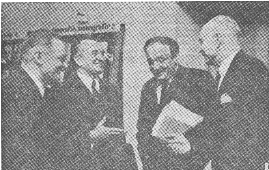
Im Sejm sind neben der Vereinigten Polnischen Arbeiterpartei (VPAP = Kommunisten) auch andere Parteien vertreten, die sich allerdings nicht als Opposition verstehen dürfen. Hier Vertreter der Vereinigten Bauernpartei.

tige politische und sozioökonomische Beschlüsse zu fällen; sie schafft nicht die Möglichkeit zur entsprechenden Gestaltung der grundlegenden Richtlinien der staatlichen Finanzpolitik, und sie garantiert schliesslich nicht die parlamentarische Kontrolle über die finanziellen Vorräte und über die Budgetposten.