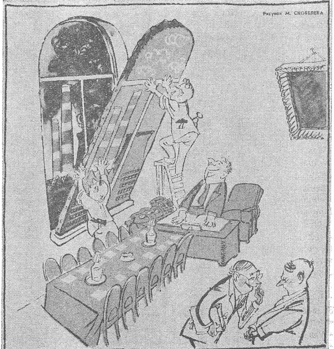
Bild links: Das Lotteriesystem der Prämienverteilung. Bild rechts: «Nach den Beschlüssen der Konferenz für Umweltschutz haben wir die Massnahmen schon getroffen.»