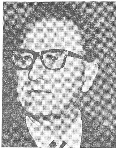
Roger Garaudy (oben) und Charles Tillon. Sie kritisierten die sowjetische Machtausübung und wurden aus der KP ausgeschlossen. Aber das hindert die besseren Leute nicht daran, der KPF eine Öffnung zum Pluralismus und vermehrte Unabhängigkeit von Moskau zu attestieren.

— Verstaatlichungen von der Art, die dem kleinen Mann seit 30 Jahren immer teuer zu stehen gekommen sind, weil die Kosten der