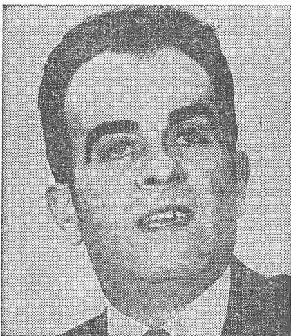
KPF-Generalsekretär Georges Marchais. Uebrigens hatte er sich während des Krieges zu einem freiwilligen Arbeitseinsatz nach Deutschland gemeldet, das damals Verbündeter der Sowjetunion war.

Schön, das alles braucht nicht zwangsläufig so zu kommen. Aber — und darüber braucht man sich keine Illusion zu machen — soweit es auf den Willen der KPF-Führung ankommt, soll es so kommen. Ihre Gutheissung des sowjetischen Modells spricht dafür. Gerade in den letzten Jahren der sowjetischen Restalinisierung hat sie sich so verhalten, als müsse sie das Wort von