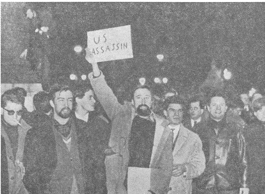
Der Gaullismus hatte der «Los-von-Amerika-Bewegung» in Europa seinerzeit wichtige Impulse gegeben. Dass daraus auch eine europäische «Hin-zur-Sowjetunion-Bewegung» geworden ist, musste beim Stand der politischen «Einigkeit» Europas ohnehin das Korrelat sein, doch die gütige Nachhilfe der interessierten Kreise trug weiter dazu bei.

— Die Ueberführung des Bodens in Gemeindeeigentum. Das ist die Massnahme, die im Westen so manchem als endgültige Lösung des Spekulations- und Wohnproblems vorschwebt. Dass sie per se überhaupt noch nichts löst, zeigt das Beispiel der UdSSR, wo die Leute in den Städten davon träumen, dass wenigstens die Wohnflächennorm von neun Quadratmetern pro Person Wirklichkeit würde. Daran ist übrigens nicht primär die Eigentumsordnung schuld (sie erleichtert die Planung und verteuert die Verwaltung), sondern das Machtmonopol der KP-