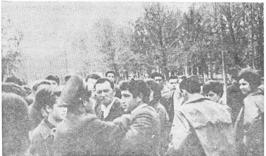
Bei einer gewaltlosen Demonstration der Krimtataren am 21. April 1968 in Taschkent griff die Polizei ein.

Am Vorabend des Volkstrauertages (18. Mai), dem Tag der barbarischen Verschleppung der Krimtataren, nehmen die lokalen Behörden Zu-