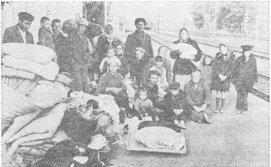
Einzelne Familien von Krimtataren waren auf eigene Initiative in die Heimat zurückgekehrt, wurden aber umgehend wieder verschickt. Hier sieht man fünf solcher Familien auf dem Rücktransport. Das Bild wurde am 21. Juni 1969 auf dem Bahnhof Ust-Labinsk aufgenommen. Es sagt nebenbei auch einiges über die internen Freizügigkeitsrechte der Sowjetbürger aus.

Die Tragödie der Krimtataren ist nur ein Akt in der Tragödie aller Völker Russlands — vom russischen über das ukrainische und die baltischen... bis zu den Juden, die eines wie das andere der Freiheit beraubt sind und im Völkergefängnis, das sich Sowjetunion nennt, unterdrückt werden. Wir glauben aber, dass das Recht über usurpierte Macht triumphieren muss und wird. Dann erhält auch das Krimtataren-volk Freiheit und Heimat. ■