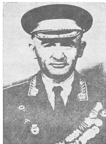
General Grigorenko, der als Bürgerrechtskämpfer auch für die Rechte der Krimtataren eintrat, worauf ihn die Machthaber definitiv versorgten.

In der Nacht vom 17. auf den 18. Mai 1944 haben Berija-Banden die Krimtataren ihrer gesamten Habe beraubt, sie in Vieh- und Güter-