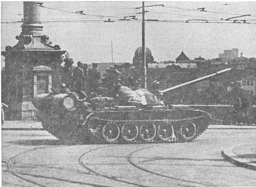
21. August 1968: Sowjetische Panzer in Prag. Der militärische Überfall auf die CSSR stellt nach sowjetischer und sowjetabhängiger Rechtsinterpretation nichts weiter dar als eine Anwendung des proletarischen Internationalismus. Und diesem wird ausdrücklich Vorrang vor Verfassungsrecht, Völkerrecht und zwischenstaatlichem Vertragsrecht zugebilligt, auch in Richtung nichtsozialistischer Staaten übrigen. Das sind unsere Partner.