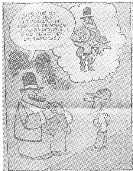
Der enteignete Industrieboss zum Arbeiter: «Warum bilden wir nicht zusammen einen Bund von Arbeitgebern und Arbeitnehmern? Als Gegenleistung könntet ihr uns die Fabriken zurückgeben.»

Diese Karikaturen aus einer regierungsfreundlichen chilenischen Zeitung bieten dem Betrachter sozusagen klassische kommunistische Feindschablonen. Allerdings — und das ist der Unterschied zu unseren üblichen Karikaturensseiten aus dem Sowjetlager — ist das nur die eine Seite in der öffentlichen Auseinandersetzung. Der beschimpfte «Klassenfeind» hat noch die Freiheit zur öffentlichen Gegenäußerung und benutzt sie auch, wie sich anhand oppositioneller Karikaturen (siehe «Lateinamerikanische Uebersicht», Seite 2 ff) erschen lässt. Aber die Zeichnung rechts nebenan deutet bereits an, dass sich das ändern könnte.