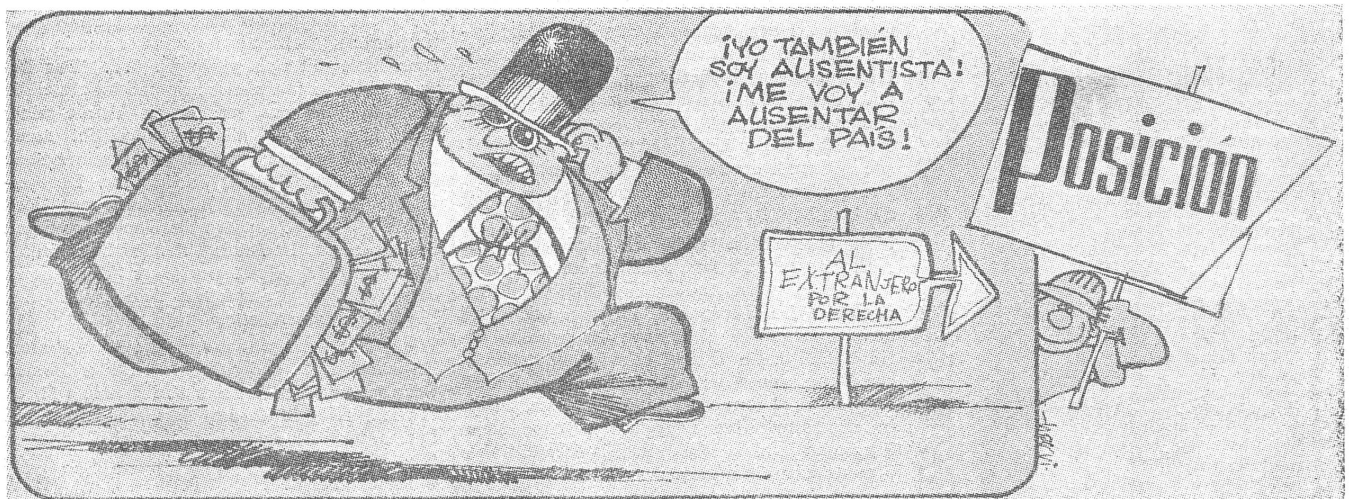
Ein à propos eines flüchtenden Kapitalisten zur Kampagne gegen den Absentismus in den Betrieben: «Auch ich bin Absentist. Ich absentiere mich (nach rechts ins Ausland) vom Land.»