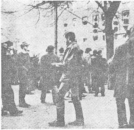
Dezember 1970 in Gdansk: Das ausgebrannte Wojewodschaftsgebäude der Partei. Die Wut der Arbeiter richtete sich gegen das, was das System repräsentierte.

spontan sofort neue Arbeiterräte gebildet wurden, die man allerdings wieder aufgelöst hat.