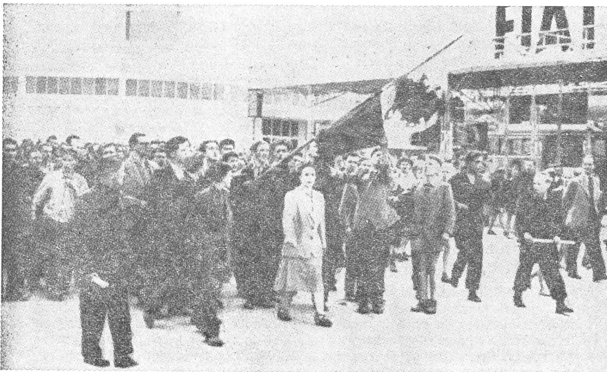
Der «polnische Oktober» hatte sein «Vorspiel» im Aufstand von Posen, der niedergeschlagen wurde. Ein Bild vom 29. Juni 1956: Demonstrierende Arbeiter führen eine polnische Fahne mit sich, die sie mit dem Blut eines Buben getränkt haben, der während der Unruhen umgekommen ist. Insgesamt gab es 38 Tote und 270 Verletzte.

Tatsächlich hatte man 1956 eine gewisse Selbstverwaltung der Arbeiterräte geschaffen, welche das Mitspracherecht der Belegschaften garantieren sollten. Allerdings entzog man ihnen ab 1958 stufenweise jegliche Möglichkeit, auf die Betriebsleitungen Einfluss zu nehmen, und die formell beibehaltenen Arbeiterräte funktionierten als blosse Befehlsübermittler der Direktion, so sehr, dass 1970 bei den Streiks an der Küste