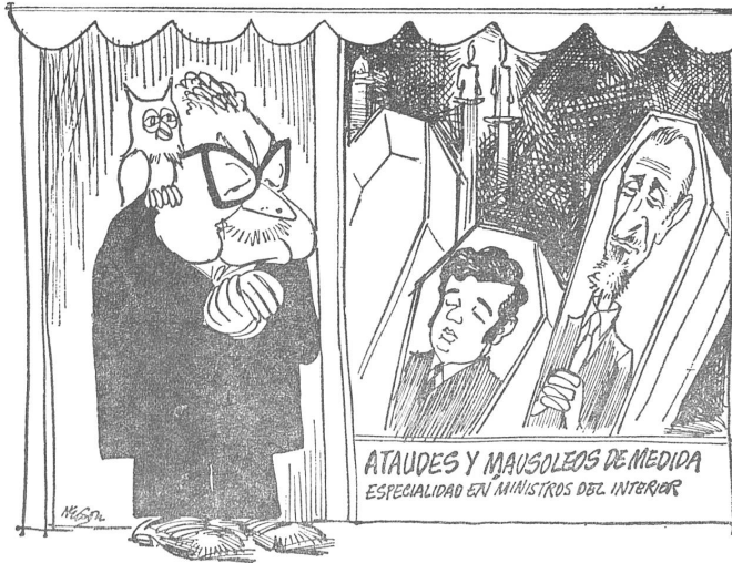
Allende musste unter dem Druck des Parlaments mehrmals Wechsel im Innenministerium vornehmen, das sich unter anderem durch handfestes Vorgehen gegen Manifestanten hervorgetan hatte, die zu Dutzenden ins Spital eingeliefert werden mussten. Zu diesen Wechseln äussert sich diese Karikatur, die in der humoristischen Beilage «Cambalache» der oppositionellen Zeitung «Sepa» (Santiago) erschien. Allende erscheint hier als Bestätigungsunternehmer: «Särge und Grabstätten nach Mass. Sonderanfertigungen für Innenminister.»

► jungen Leute sich Eintritt verschafften, war zerbrochen) und gestohlen (hierfür konnte keinerlei Beweis geliefert werden) zu haben.