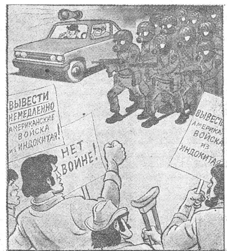
Die Zustände im Westen, wo die Soldaten gegen Demonstranten losgehen: «Freunde, wir haben eurem Wunsch entsprochen und dieses Bataillon abgezogen.»

Sehr im Unterschied zu den USA steht in der UdSSR, das Militärbudget nicht öffentlich zur Debatte. Wer hier unbequeme Fragen stellt, kommt als antisowjetisches Element ins Lager. Und wer gar Angaben von der Art, wie sie in westlichen Ländern der Weltöffentlichkeit als Information zur Verfügung gestellt werden, ins Ausland bringt, wird als Spion erschossen.