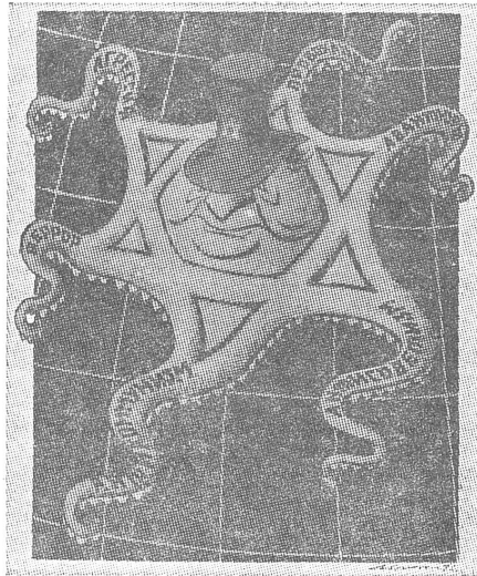
Die Fühler des (israelischen) Kraken: Aggression, Terror, Antikommunismus, Antisowjetismus, Aventurismus, Provokation. (Alle Karikaturen dieser Seite aus «Krokodil», Moskau).

Weil der Hass unerlässlich ist, muss er also durch gelenkte, monopolistische und zensurierte Information anerzogen werden, die keine Konkurrenz erträgt, wie die Prozesse gegen Andersdenkende beweisen. Er muss organisiert werden. Bedauerlich, wenn das mangelhaft geschieht: «Leider ist die Erziehung zum Hass gegen die Imperialisten und deren Armeen nicht überall gut organisiert.» Das ist wieder aus «Soldat und