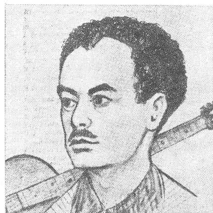
Aus der Partei ausgeschlossen: Bulat Okudschawa, der bekannteste Chansonnier der Sowjetunion.

Wenn die intellektuelle Opposition mit ihren Anliegen nirgends durchkommt, stellt sich die Frage nach der nichtintellektuellen Opposition. Man hat in der breiten Bevölkerung der UdSSR vielleicht nicht so viele Modellvorstellungen wie in den bewusst demokratischen Gruppen mit ihren Manifesten, aber man hat viele konkrete Unzufriedenheiten. Man hat einen Groll auf die schlechten Wohnverhältnisse, auf die schlechte Entlohnung, auf die Vetterliwirtschaft, auf unproduktiven Leerlauf und Verschwendung, auf die speziellen Läden und Kliniken für die Funktionäre, auf die Sonderschichten. Wenn die artikulierten Kritik an den Missständen ausfällt, kann sich die unartikulierte Wut darüber vielleicht lange relativ unbemerkt ansammeln und eines (wahrscheinlich fernen) Tages explodieren. Die gewaltsame Unterdrückung der rationalen Stim-