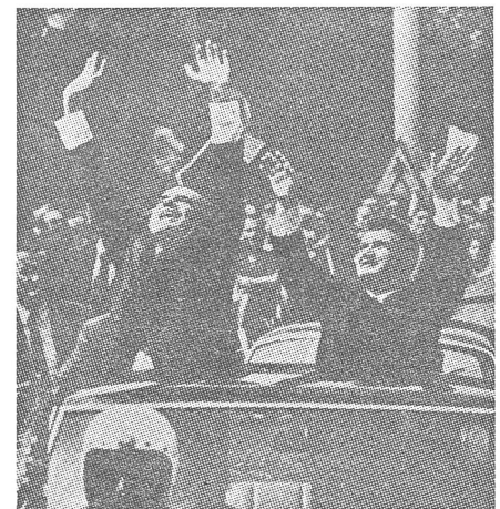
Bukarest 1969: Ceausescu lässt sich mit Nixon gemeinsam bejubeln. Der aussenpolitische Kurs der Selbstbehauptung gegenüber der Sowjetunion, den Rumänien nach seinen Möglichkeiten einschlägt, darf nicht mit Liberalisierung verwechselt werden. Eine solche hat es zwar zwischen 1968 und 1970 in gewissem Ausmass gegeben, aber seit letztem Jahr ist das dogmatische Denken wieder massgeblich geworden.

Natürlich habe auch ich mich gefragt, woran ich eher glauben solle: An die kurze «Glorie» von drei/vier Monaten, oder an das Schweigen zuvor und hernach. Ich habe die Erhöhung gekostet und die Erniedrigung. (...) Noch auf dem Boden des Abgrundes spürte ich in meinen Lungen den Sauerstoff, den ich oben auf dem Berg geatmet hatte.