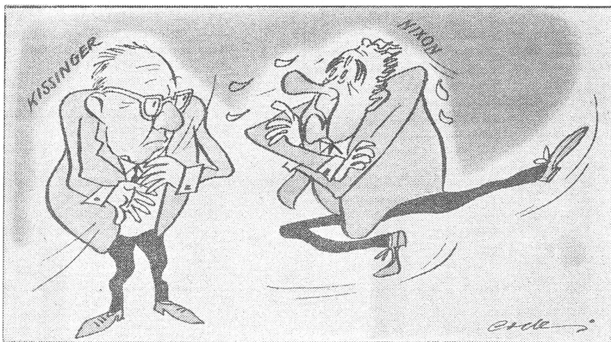
Nixon zu Kissinger: «Weisst du, Henry, russisch zu tanzen ist denn doch viel schwieriger als mit Stäbchen zu essen.» («Ludas Matyi», Budapest)

Diese Auffassung hat tatsächlich allerhand für sich. In Peking hatten selbst amerikanische Zugeständnisse dem direkten amerikanischen Interesse an neuer Bewegungsfreiheit gedient. Bei der Moskauer Supermacht geht es um gegenseitige Positionen.