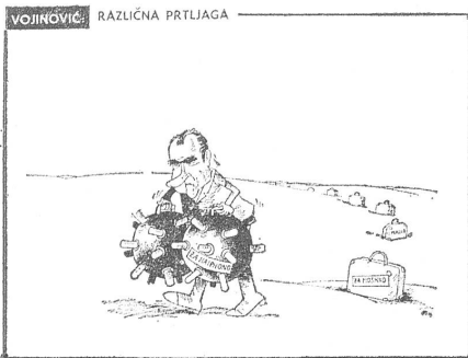
Verschiedenerlei Gepäck (für Peking, Moskau oder Haiphong). «Dnevnik», Novi Sad.