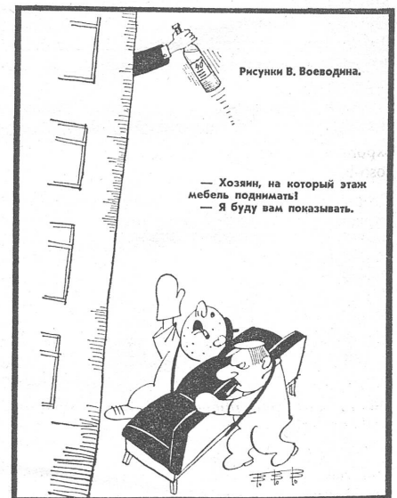
«He, Chef, in welche Etage kommen die Möbel?» — «Ich zeig es euch!» («Ogonjok»)