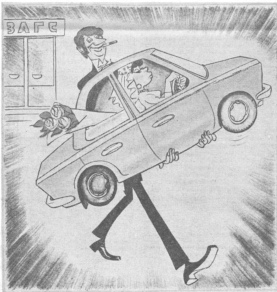
Braut mit Mitgift. («Krokodil», Moskau)