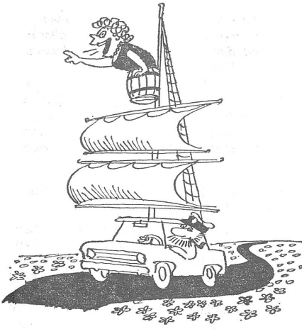
Ein bis zum Ausbau des Benzinservice empfohlenes Gefährt für die Landstrasse. («Ogonjok», Moskau)