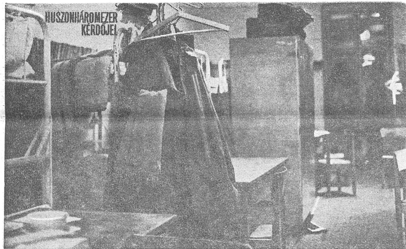
Was der Ausdruck «überfüllte Studentenheime» konkret bedeutet, veranschaulichen vielleicht diese Bilder, die allerdings aus dem Jahre 1965 stammen. Sie zeigen im damaligen Zustand das Studentenheim der Budapester Technischen Hochschule, in einer ehemaligen Kaserne eingerichtet. Oben ein Gang, links ein Zimmer für 26 Studenten. Keine Waschbecken, kein garantierter Tischanteil. Nun, das war schon damals ein abschreckendes Beispiel (aber keine Ausnahme, wie die Reportage von «Tükör», Budapest, vermerkte), und es hat wahrscheinlich gebessert. Aber von einem Vorbild kann keine Rede sein.

Hier wies der Minister persönlich darauf hin, wie wir die demokratischen Rechte auslegen sollen. Ein Vertreter der Technischen Universität Budapest hatte nämlich von einer Meinungsumfrage unter Studenten über das Niveau des Unterrichts berichtet. Wir brauchen kaum zu sagen, dass diese Untersuchung bei den Professoren kein gutes Echo gefunden hat. Aber der Minister betrachtete diese Meinungsumfrage nicht als «Häresie». Denn die Studenten sind erwachsene Menschen. Sie haben als Staatsbürger und als Erwachsene das Recht auf Kritik. Warum sollten ihnen gerade ihre Professoren tabu sein?