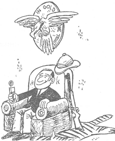
«In Gold we trust.» Karikatur von «Punto Final», Santiago de Chile. Der Spott auf den Dollarglauben ist schon recht, aber zur Behebung der finanziellen Schwierigkeiten im eigenen Lande reicht er nicht.

nach der langen Einfrierung wieder an, aber kaum genügend, um die Wirtschaft ankurbeln zu können.