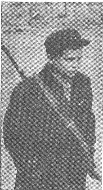
Ein jugendlicher «Konterrevolutionär» 1956. Mit der Hinrichtung von Jugendlichen wartete man nach der Revolution zu, bis sie 16 Jahre alt geworden waren.