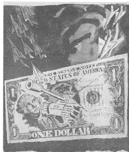
Die Dollarkrise als Folge des Vietnamkrieges. («Krokodil», Moskau, Nr. 20, Juli 1971)

Trotz der anhaltenden Passivität der Zahlungsbilanz, die bestenfalls noch Jahre zur Ueberwindung braucht, bewegt man sich grosso modo doch nach oben, und das im Unterschied zu Japan und den wichtigsten westeuropäischen Ländern. Die «Organization for Economic Cooperation and Development» und die «Economic Commission for Europe» haben vor kurzem eine Uebersicht veröffentlicht, in der die «reale» Zunahme des Sozialprodukts, also unter Berücksichtigung der jeweiligen Inflationsquoten, augenfällig gemacht wird. Eine negative Zahl