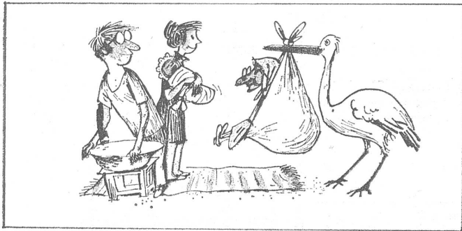
«Mascha, die ist für uns! Aus dem Büro für gute Dienste!» («Krokodil», Moskau, Nr. 30/1971)

Vom Storch wünscht man sich die obligate Babuschka (Grossmutter) zum Kinderhüten.