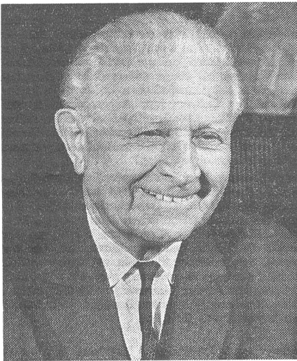
«Gütige Vaterfigur» Svoboda in einer Aufnahme vom 10. Juni 1968. Auch Marschall Pétain war eine Vaterfigur gewesen, bevor er zum Präsidenten eines Okkupationsregimes wurde.