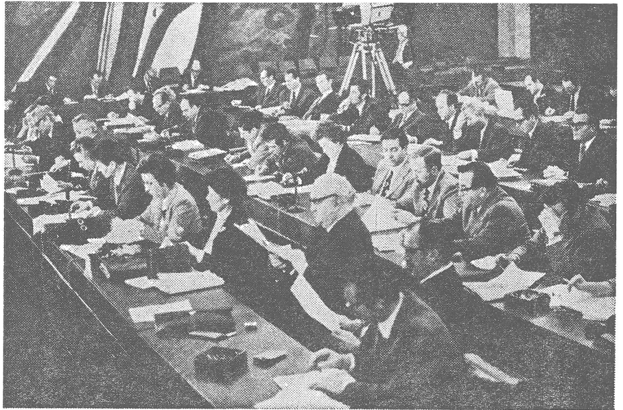
Die 23. ZK-Sitzung der kroatischen KP besiegelte in Zagreb den Wechsel in der Führungsspitze, nachdem es der Partei in dieser Teilrepublik zuvor nicht klar gewesen war, ob man den Sezessionismus mit Entgegenkommen oder mit Entgegentreten behandeln müsse.

Die Ursachen der gegenwärtigen ideellen Krise im BdKJ waren die seit langem schwelenden Meinungskonflikte über wesentliche Fragen des Verhältnisses zwischen Bund und Republiken, des Souveränitätsausmasses der Republiken, der Wirtschafts- und Gesellschaftspolitik. Alles Fragen, die im Zusammenhang mit den Verfassungsänderungen zu kaum noch verhüllten Kampffronten zwischen den Republikorganisationen der Partei geführt hatten. Man hatte den Eindruck, dass der BdKJ keine einheitliche Partei mehr sei. Sogar Tito selber bezeichnete im