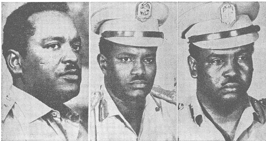
Die kurzfristigen Machthaber nach dem Putsch vom 19. Juli: Oberst Nur, Major Ata und Major Khamdakh. Sie wurden nach Numeiris Gegenputsch hingerichtet.

Die grosse Bedeutung, die man in Moskau der SKP zumisst, kam kürzlich in einem wichtigen Buch zum Ausdruck: «Die politischen Parteien Afrikas», Ende 1970 in Moskau in russischer Sprache vom Afrika-Institut der Akademie der Wissenschaften der UdSSR veröffentlicht. Dieses Institut darf wohl als ideologischer Kommandoposten und als Ausbildungszentrum für die sowjetische Tätigkeit in Afrika bezeichnet