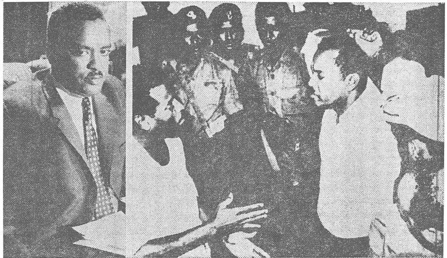
Oberst Babikar Nur stelle sich in London als Präsident des betont prokommunistischen Putschregimes vor. Dann wurde er in Libyen (mit einem antikapitalistischen, antiwestlichen, antikommunistischen und antisowjetischen Regime) gekidnappt und nach dem Sudan ausgeliefert, wo ihn Numeiri, inzwischen wieder an der Macht, erschossen liess (Bild rechts: Oberst Nur vor seiner Hinrichtung).

Der Abschnitt des Buches über den Sudan schliesst mit einem grossen Lob für General Numeiri, dessen Unterstützung durch die SKP betont wird: «Am 25. Mai 1969 stürzten die revolutionären demokratischen Kräfte der Armee in Verbindung mit andern progressiven Kräften das Regime der reaktionären bürgerlichen Grundbesitzer (das heisst die Regierung von Zivilisten, die seit der Absetzung Abbouds im Amt war). Das progressive Regime, an der Macht seit der Revolution vom 25. Mai, arbeitete ein breites Programm umfassender sozialwirtschaftlicher und politischer Reformen im Interesse der Werktätigen aus... Die Machtübernahme durch ein progressives Regime