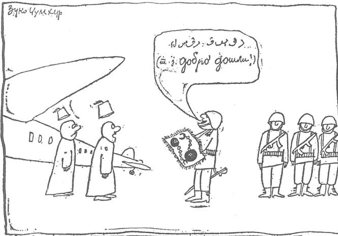
Putsch-Präsident Nur wurde in Libyen zuhause von Numeiri gekidnappt, nachdem man sein Flugzeug in Benghasi zur Landung gezwungen hatte: «Willkommen!» («Politika», Belgrad, 23. Juli 1971)

einige Kommunistische Partei Ägyptens für eine Unterstützung der Regierung Nasser aus... Die Partei verlangte für die Kommunisten das Recht auf Anerkennung und Legalität... Im Sommer 1962 wurde die Nationale Charta (durch Nasser) proklamiert;... sie definierte den wissenschaftlichen Sozialismus als besten Weg des Fortschritts... Die progressive Politik Nassers erhielt allgemeine Unterstützung. Indessen waren die Kommunisten — wenigstens ein beachtlicher Teil unter ihnen — immer noch Gefangene des Fraktionsdenkens... Das falsche Fraktionsdenken der Kommunisten isolierte diese von den Massen... Im Frühjahr 1964 überprüften die ägyptischen Kommunisten ihre Politik und änderten ihre Haltung gegenüber der Regierung Nasser. Als Folge wurden alle Kommunisten aus den Gefängnissen entlassen... Im März und April 1965 wurde die Auflösung der kommunistischen Organisationen beschlossen; deren Mitglieder sollten einzeln der Arabischen Sozialistischen Union (der staatlichen Einheitspartei Nassers) beitreten... Kurz nach der Auflösung der kommunistischen Organisationen traten viele Kommunisten in den Staatsdienst ein; etliche konnten führende Stellungen in der Arabischen Sozialistischen Union einnehmen...»