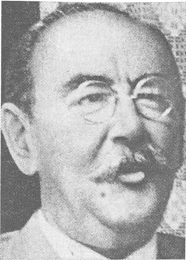
Imre Nagy, während der ungarischen Revolution Ministerpräsident vom 24. Oktober bis 4. November 1956.

Nagy (Jahrgang 1896) hatte im kommunistischen Ungarn bereits einer Regierung vorgestanden, nämlich zwischen 1953 und 1955. (Während jener Zeit hatte er übrigens Janos Kadar aus dem stalinistischen Gefängnis entlassen. Auch wurde Kadar während der Revolution, einen Tag nach der Bildung der Regierung Nagy, neuer Parteichef. «Seine» neue Regierung rief er am 4. November in Ostungarn aus, als er sich in sowjetischem Gewahrsam befand.)