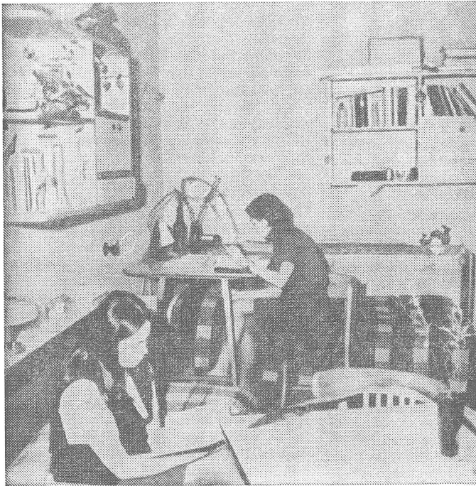
Zimmer im Warschauer Studentenheim «Riviera»

«Unter den 200 000 polnischen Studenten haben 120 000 (d. h. etwa 60%) den Anspruch darauf, in einem Studentenheim untergebracht zu werden. Wie werden diese Anrechte in der Praxis realisiert? Gegenwärtig gibt es in Polen über 300 Studentenheime, in denen etwa 80 000 Studenten untergebracht sind.»