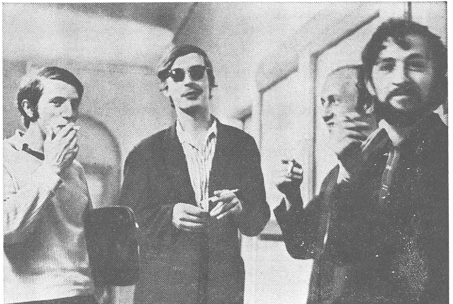
Polnische Studenten. Und diese hier, was studieren sie wohl? Sie studieren Theologie an der Katholischen Akademie in Warschau.

Warum hat bis heute niemand den Mund aufgemacht? Weil niemand reden durfte, weil es unangenehme Folgen gehabt hätte. Ich erinnere