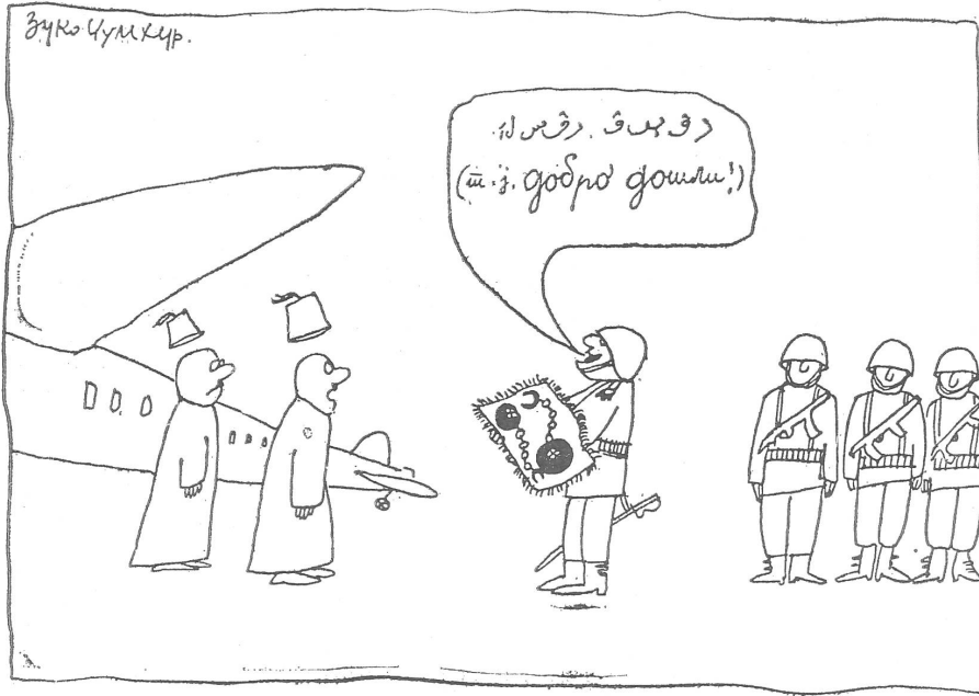
Das libysche Staatskidnapping des interimistischen Umsturzpräsidenten El Nur aus einem britischen Flugzeug: Empfang in Benghasi: «Willkommen!» («Politika», Belgrad)