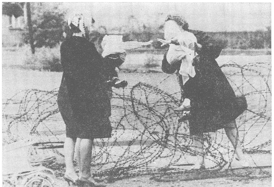
Kurz nach Mitternacht vom 12. auf den 13. August 1961 wurde die Zonengrenze zwischen Ost- und Westberlin mit Stacheldraht abgeriegelt. Am Morgen waren zahllose Familien getrennt. Die kleinen Spielgefährten, die sich hier über dem Stacheldraht zum letzten Male ihre Händchen zustrecken, sind mittlerweile über zehnjährig und kennen sich nicht mehr.

Einigkeit im Willen zur Freiheit ist die Voraussetzung für die Erhaltung der Freiheit. Das ist ein Beitrag, den jeder leisten kann. Peter Sager