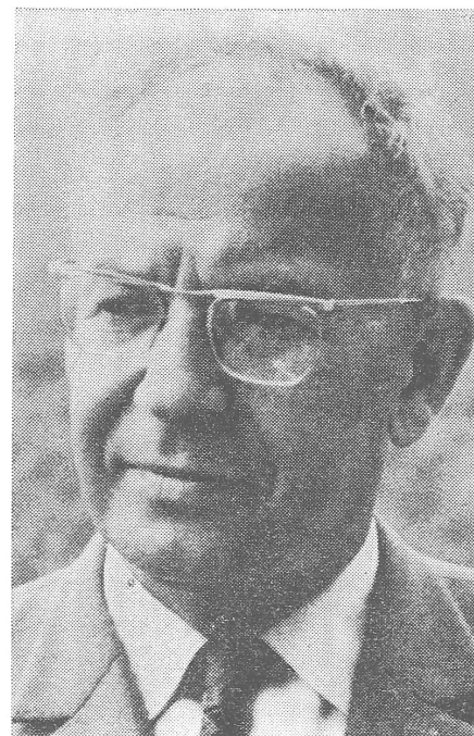
Ludvik Svoboda. Die Fahne ...